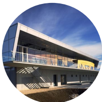
Sporthalle Buchholz, Uster