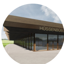
Sporthalle Hüssenhüel, Hinwil