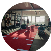
Krafraum Pfäffikerstrasse, Uster